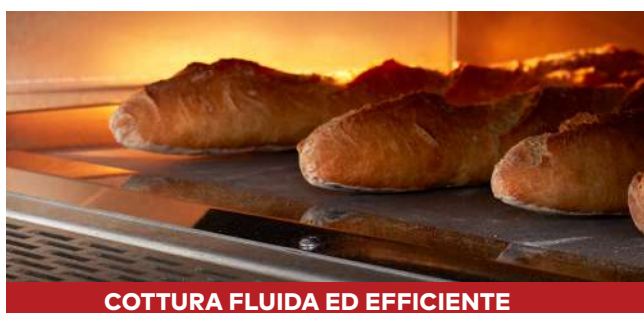
COTTURA FLUIDA ED EFFICIENTE

Hanno 4 piani: 1 piano elettrico e 3 piani a tubi ad anello, alimentati a gas naturale, propano o olio combustibile.